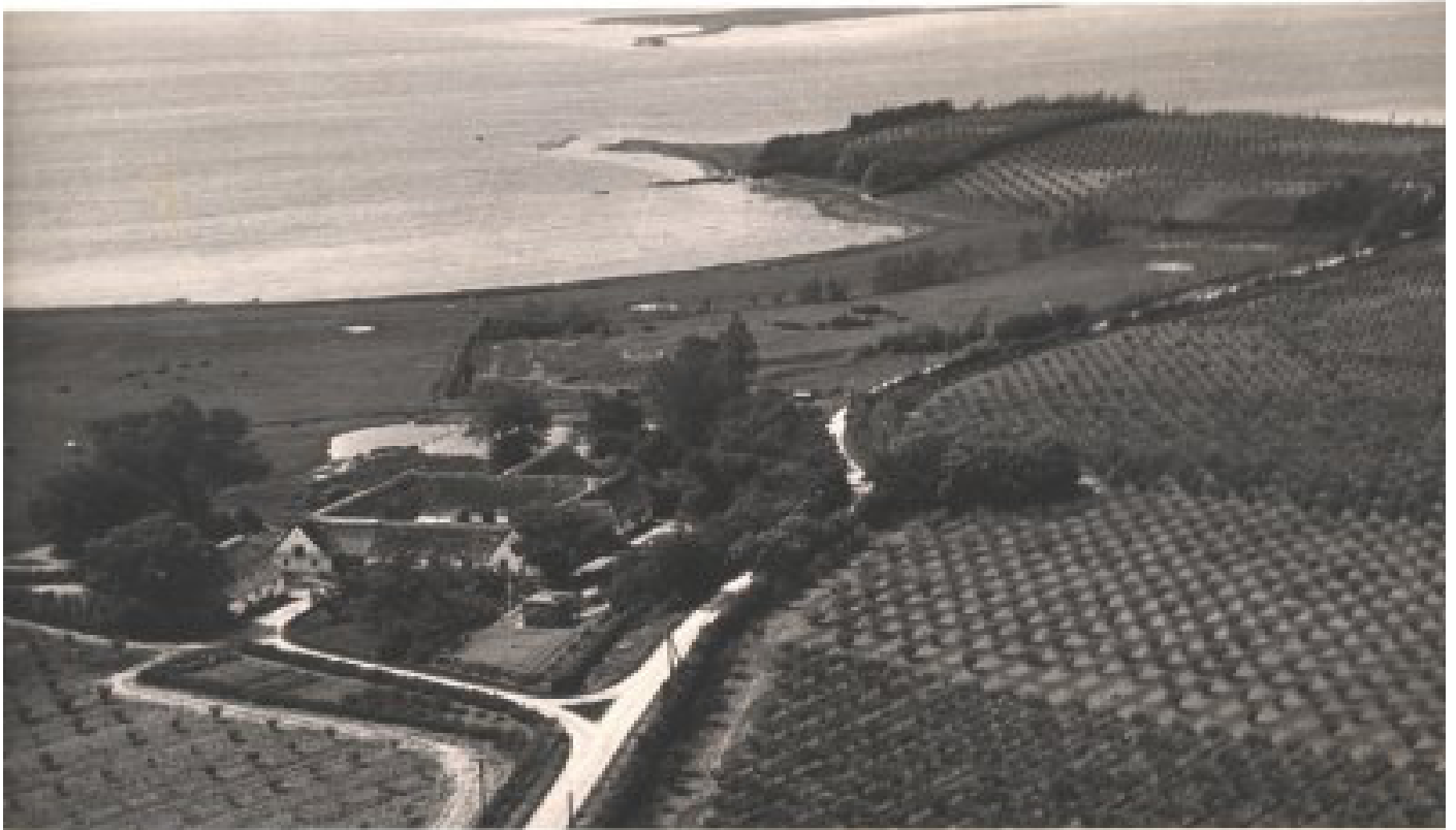
Luftfoto af Hammergården ca. 1950