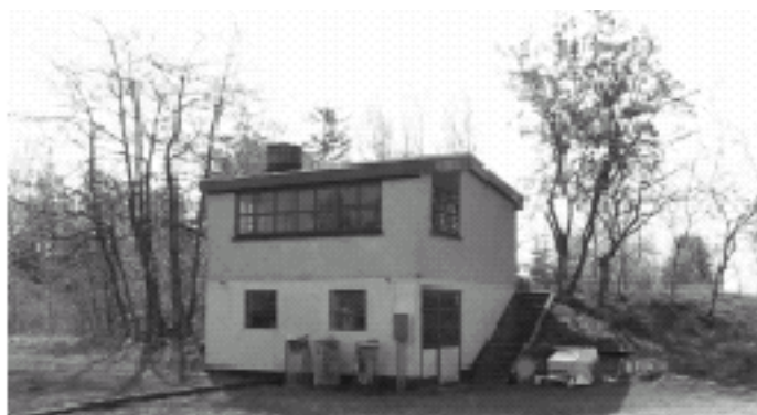
Det tidligere sprøjtehus

En anden bygning, der er direkte relateret til frugtavlere, er det tidligere sprøjtehus, som nu bruges af Nordhammer Bådelaug. Bygningens højde skyldtes, at man skulle kunne køre hen til den med en sprøjtevoan og fra tagetagen fylde kemikalierne på sprøjten.